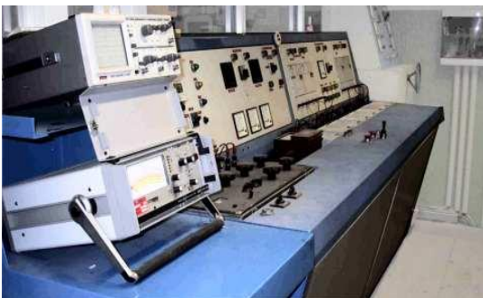
Sala prove trasformatori MT