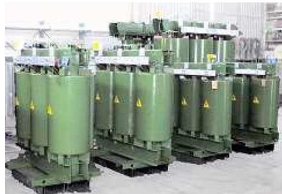
Trasformatori in resina pronti al collaudo