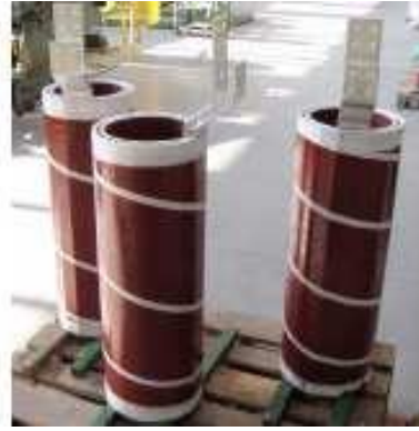
Avvolgimento B.T. per trasformatore in resina