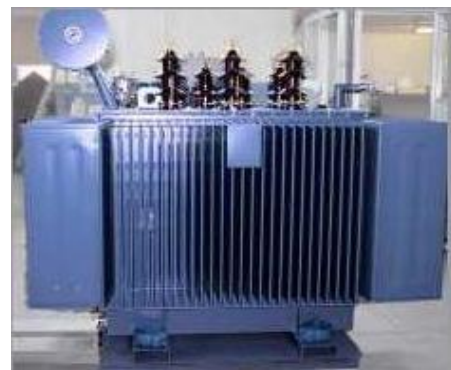
Trasformatore MT in olio

dimensioni e pesi sono solo indicativi e possono essere variati in qualsiasi momento senza alcun preavviso