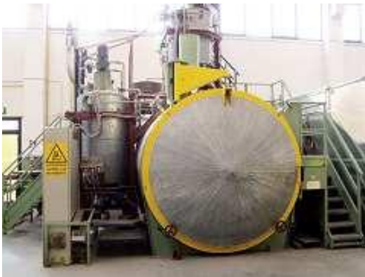
Impianto di inglobamento in resina con stoccaggio e miscelazione