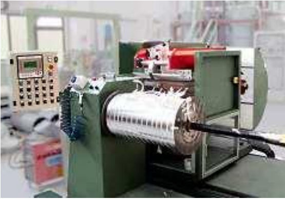
Realizzazione di avvolgimento M.T. per trasformatore in resina, con macchina completamente automatica

Grazie all'impianto di inglobamento, stoccaggio e miscelazione delle resine completamente automatizzato e controllato da un sistema di supervisione computerizzato con software dedicato, è in grado di offrire una resina di qualità superiore